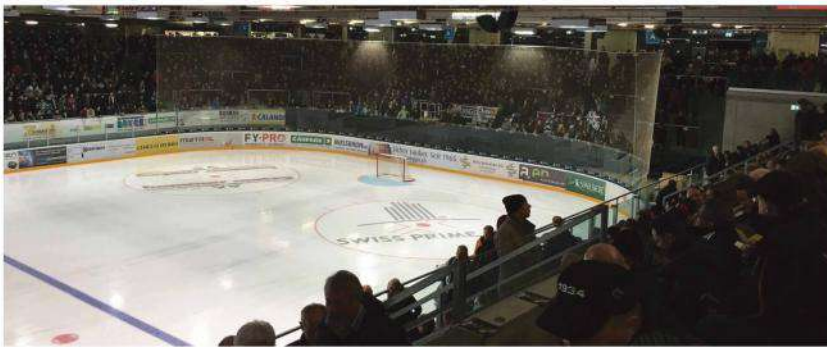
Jugendabo und Sponsoren sei dank: Ab sofort profitieren weitere Schüler von Gratis-Eintritt ins Kleinholz.

zuletzt bewiesen.» Wolle der EHCO seine hohen Ziele erreichen, dann würden Niederlagen gegen Teams wie die Rockets nicht drin liegen. Und sollte es spielerisch einmal nicht klappen, dann hat der EHCO mit Gerbers Physis eine neue Waffe, um ein Spiel doch noch zu gewinnen.